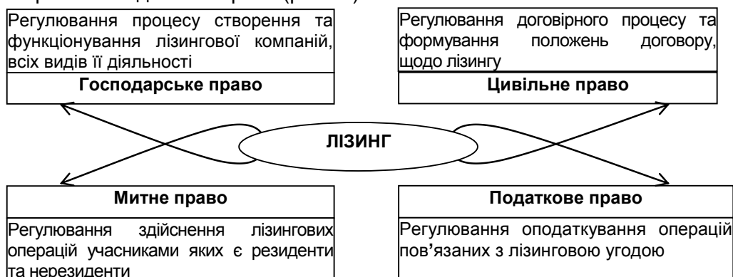
Рис. 1. Лізинг в системі галузей права

Таким чином, лізинг знаходиться на перетині різних галузей права, зважаючи на свою багатогранність. Кожна галузь, регулює відповідну сферу лізингу та напрям його прояву як економічного явища. Зважаючи на економічну природу лізингу, основними галузями права в системі яких містяться положення щодо лізингу, лізингових операцій, лізингових відносин є господарське право, цивільне право, митне право та податкове право (рис. 1.).